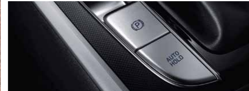
Electronic Parking Brake with auto Hold