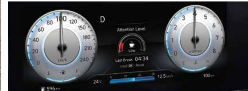
10.25" Full Colored TFT-LCD Cluster Screen