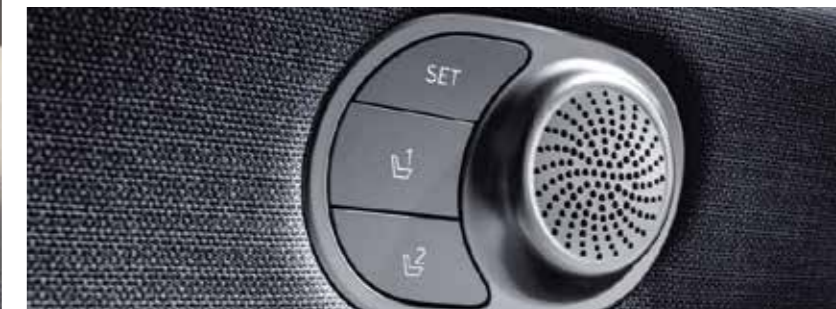
Powered Driver Seat With Integrated Memory