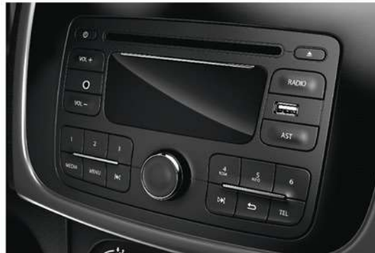
Radio MP3, USB, AUX راديو MP3 مع مخارج USB و AUX