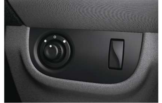
Electric Adjustable Door Mirrors المرآيات الجانبية يتحكم كهربائي