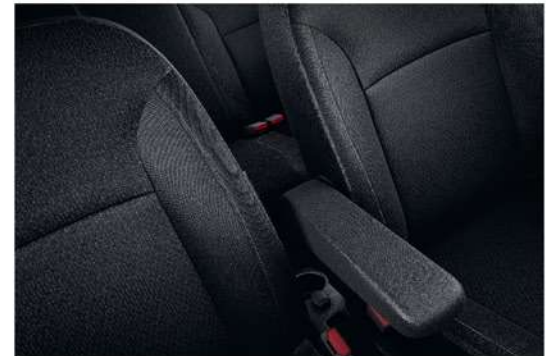
Front Arm Rest مسند يد أمامي