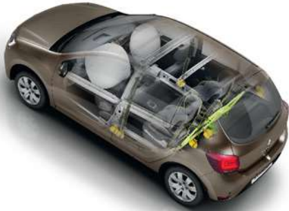
Dual Front Airbags وسائد هوائية للسائق والراكب الأمامي