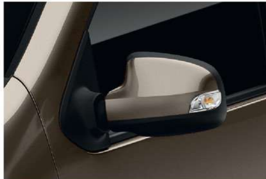
Turn Signals Integrated in Side View Mirrors إشارات الإنعطف مدمجة في المرايا الجانبية