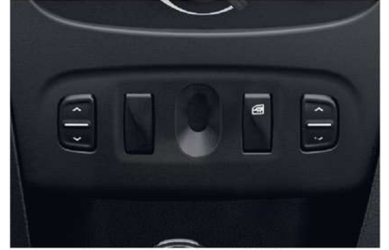
Front and Rear Electric Windows زجاج كهربائي للأبواب الأمامية والخلفية