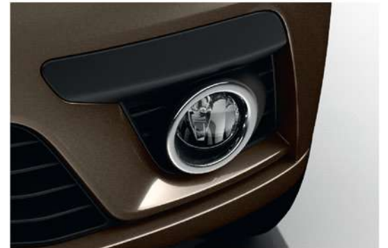
Front & Rear Fog Lights مصابيح ضباب أمامية وخلفية