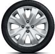
15" Decade Hubcaps - Steel Wheels (185/65)