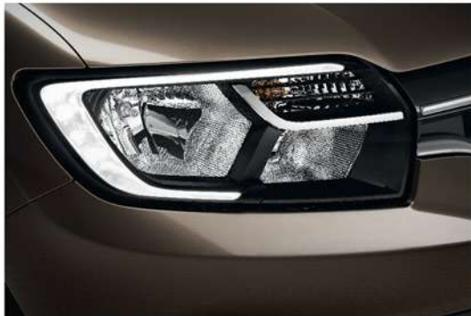
C-Shape LED Daytime Running Lights إضاءة نهائية LED تعمل عند تشغيل المحرك