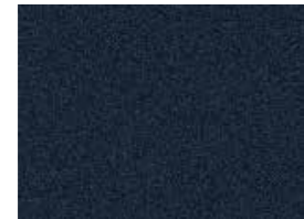
Starry Night UB7