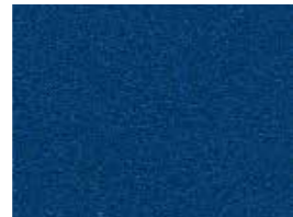
Alpha Blue U3R