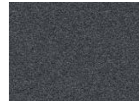
Titan Gray R4G