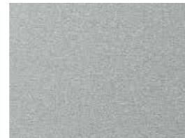
Typhoon Silver T2X