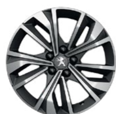
17" MERION, diamond cut, two-tone