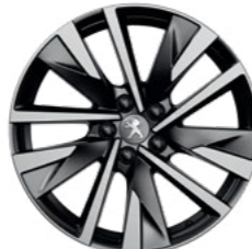
18" Two-Tone Alloy Wheels