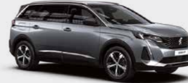
Cumulus Grey رمادي كومولس