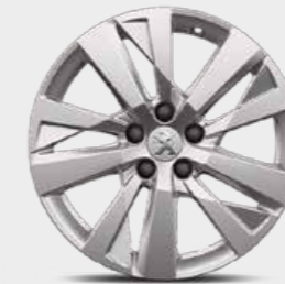
17" ALLOYS "CHICAGO", Michelin Primacy 4 عجلات ألومنيوم "شيكاغو" قياس 17 بوصة، ميشلان برايمسي 4

لتعزيز مظهر سيارتك، اختر ما يعجبك من بين العجلات الثلاث المتوفرة لدينا.