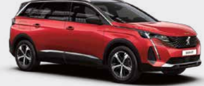
Ultimate Red أحمر ألتيمت