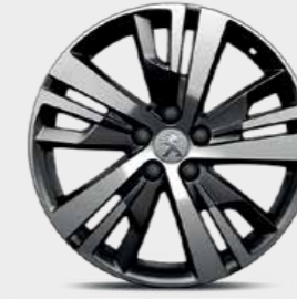
18" ALLOYS "DETROIT", diamond cut, Michelin Primacy 3 عجلات ألومنيوم "ديترويت" قياس 18 بوصة، قصة ألماسية، ميشلان برايمسي 3