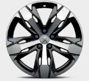
18" ALLOYS "LOS ANGELES", diamond cut, Continental CCLX2 عجلات ألومنيوم "لوس أنجلوس" قياس 18 بوصة، قصة ألماسية، كونتيننتال CCLX2