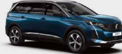
Celebes Blue أزرق سيليس