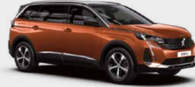
Metallic Copper نحاسي معدني

اختر لونك المفضل من مجموعة الألوان المتوفرة، وابرز شخصيتك أينما كنت.