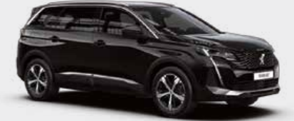
Black Perla Nera أسود لؤلؤي نيرا