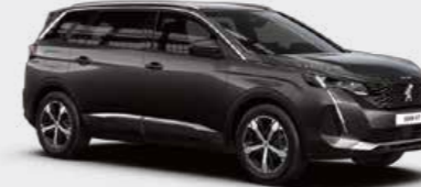
Platinum Grey رمادي بلاتينيوم