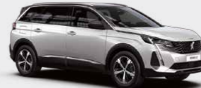
Pearlescent White أبيض لؤلؤي