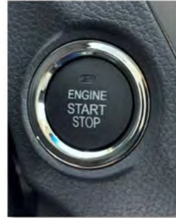
نظام المفاتيح الذكي (مفتاح بصمة)