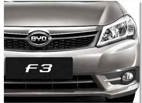
شبكة أمامية كروم ذات تصميم عصري