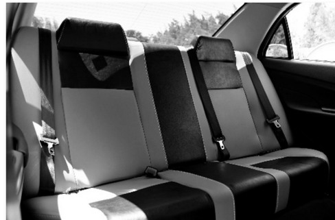
كراسي خلفية تتسع لثلاث ركاب