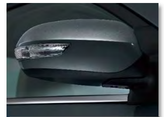
إشارات بالمرابيات الجانبية