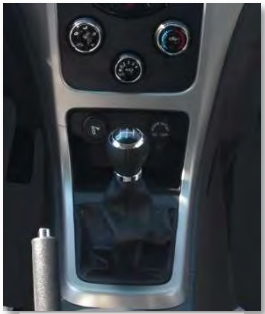
ناقل حركة يدوي

راديو / USB / مدخل صوت خارجي AUX - تكييف هواء - باور ستيرنج - عجلة قيادة قابلة للتعديل