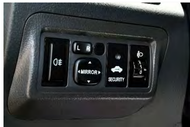
نظام إيموبيليزر- فوانيس شبور- مرابيات جانبية كهربائية