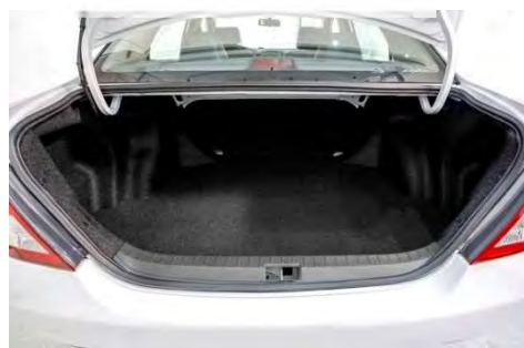
مساحة خلفية واسعة