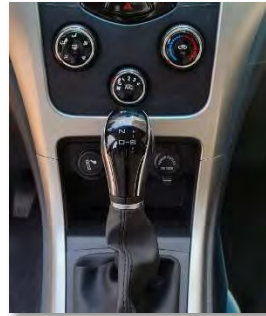
ناقل حركة أوتوماتيك