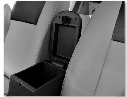
مخدع يد مزود بصندوق تخزين