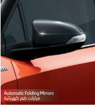
Automatic Folding Mirrors مرايات ضم كهربائية