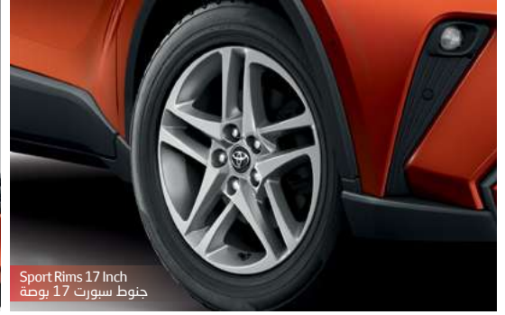
Sport Rims 17 Inch جنوط سبورت 17 بوصة