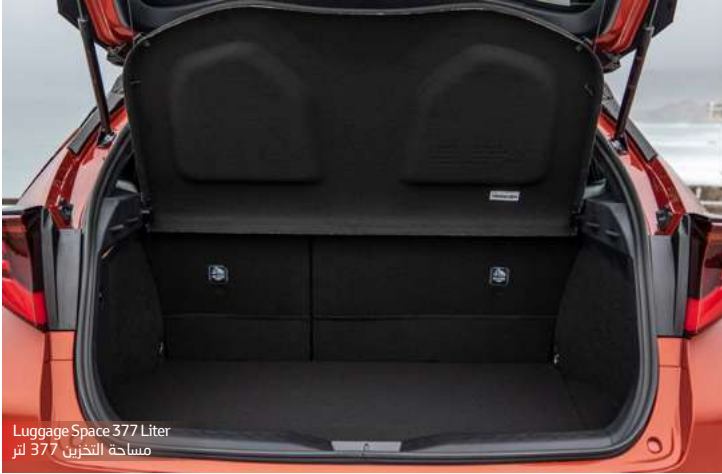
Luggage Space 377 Liter مساحة التخزين 377 لتر