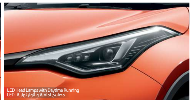
LED Head Lamps with Daytime Running LED مصباح امامية و انوار نهاريه LED