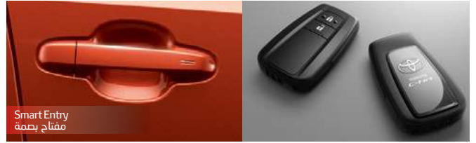
Smart Entry مفتاح بصمة