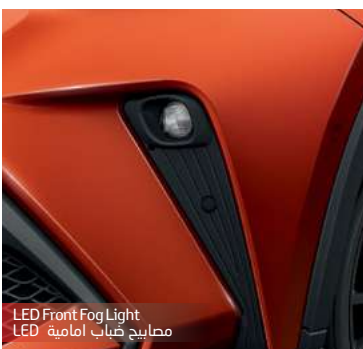
LED Front Fog Light مصباح ضباب امامية LED