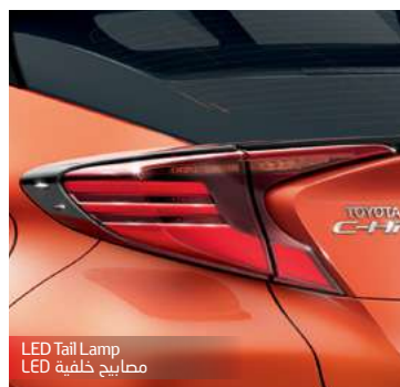
LED Tail Lamp مصباح خلفية LED