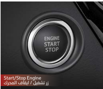
Start/Stop Engine زر تشغيل / إيقاف المحرك