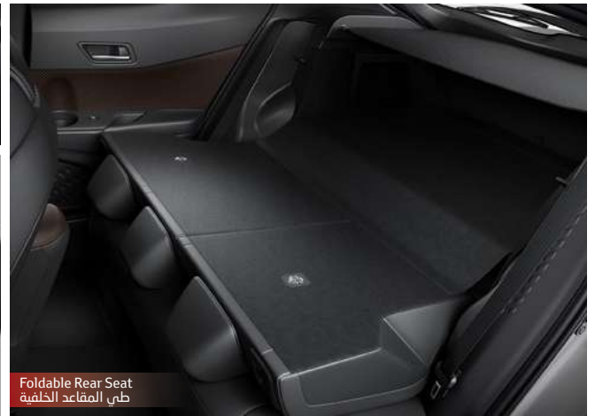
Foldable Rear Seat طبي المقاعد الخلفية