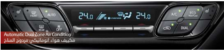
Automatic Dual Zone Air Condition مكيف هواء اتوماتيكي مزدوج المناخ