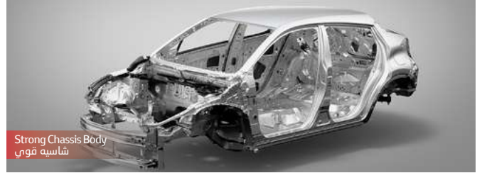
Strong Chassis Body شاسيه قوي