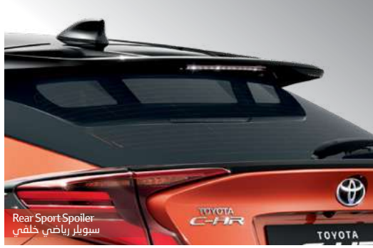
Rear Sport Spoiler سويپر رياضي خلفي